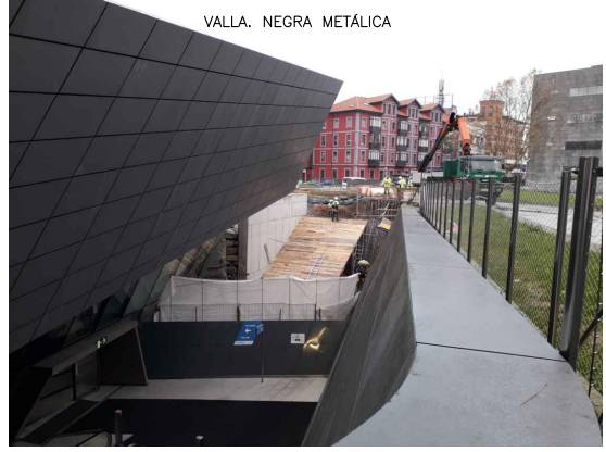
VALLA. NEGRA METÁLICA