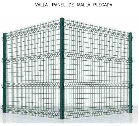
VALLA. PANEL DE MALLA PLEGADA