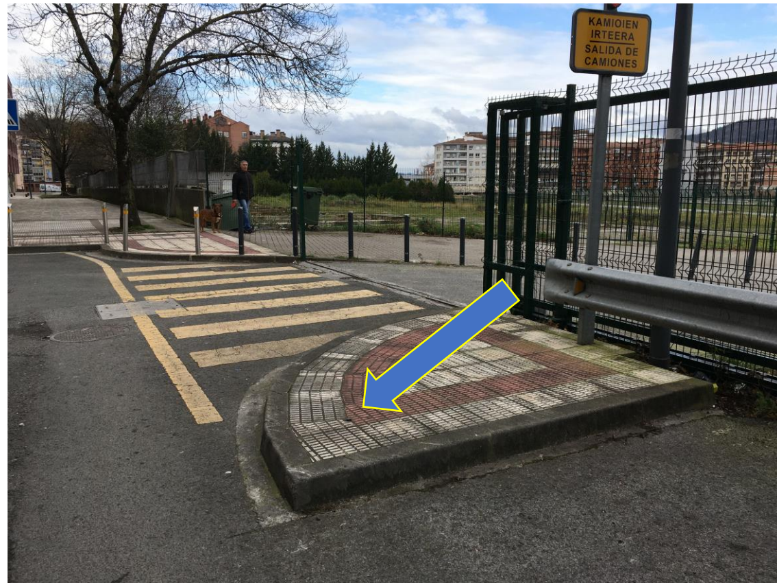
GEPUNT situado en la calle trasera de la Avenida Askatasuna, en la calle lateral cercana al número 12.