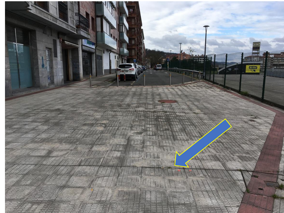
GEPUNT situado en la calle trasera de la Avenida Askatasuna, en la calle lateral cercana al número 2.