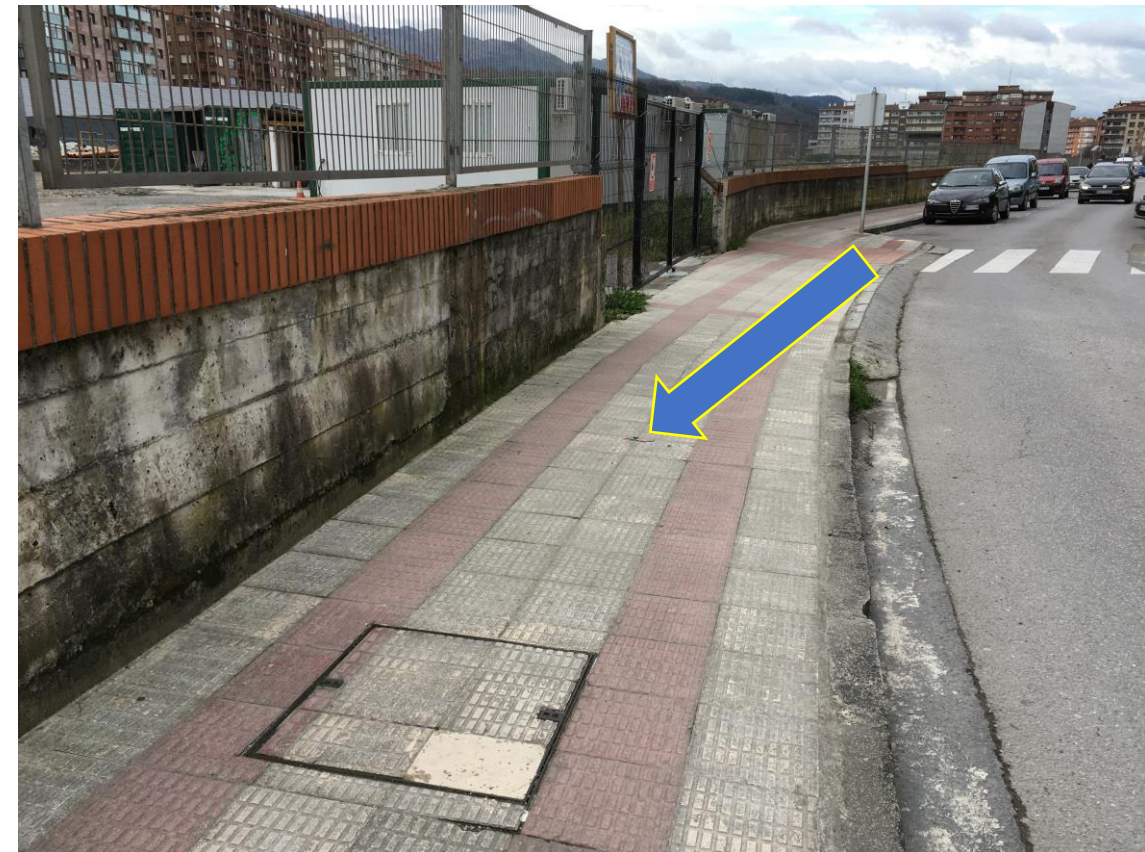
GEOPUNT situado en el entorno de la isleta triangular entre la calle Sasikoa y la calle Tronperri, actualmente cercano a la verja de entrada de la obra de acceso y cubrición.