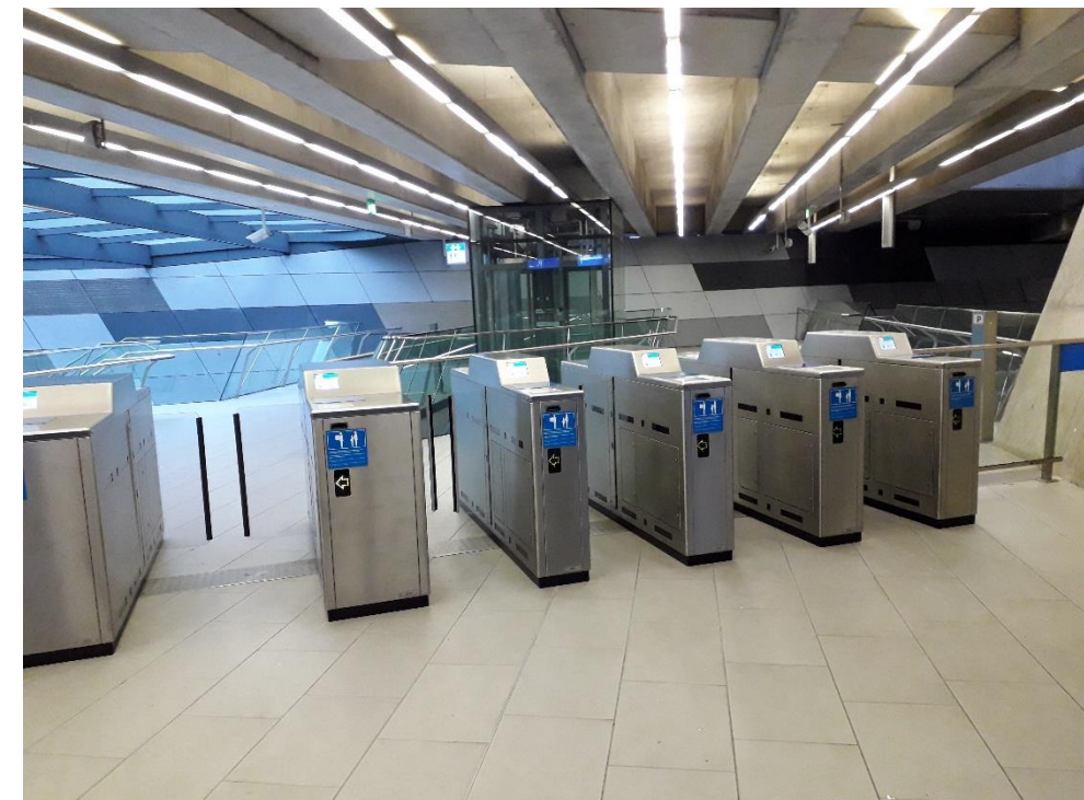
Canceladoras existentes de acceso a la mezzanina