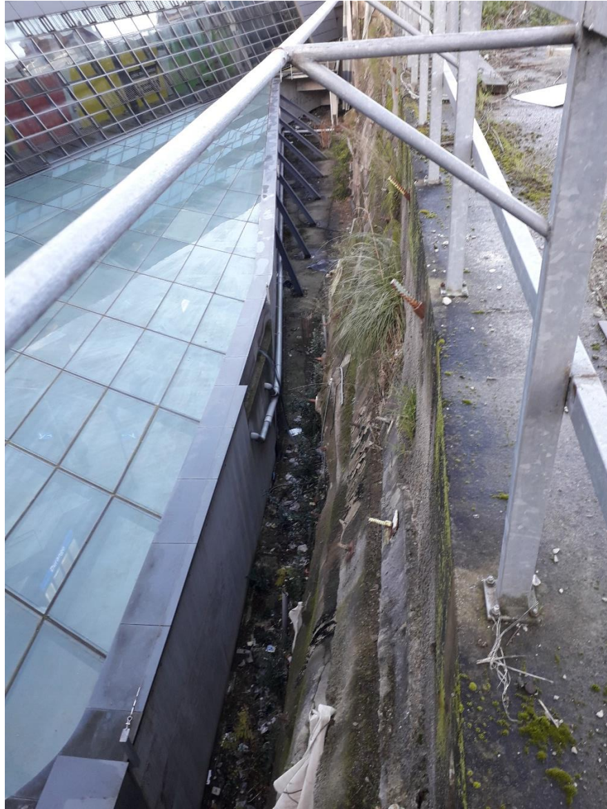
Vista desde coronación de muro provisional existente