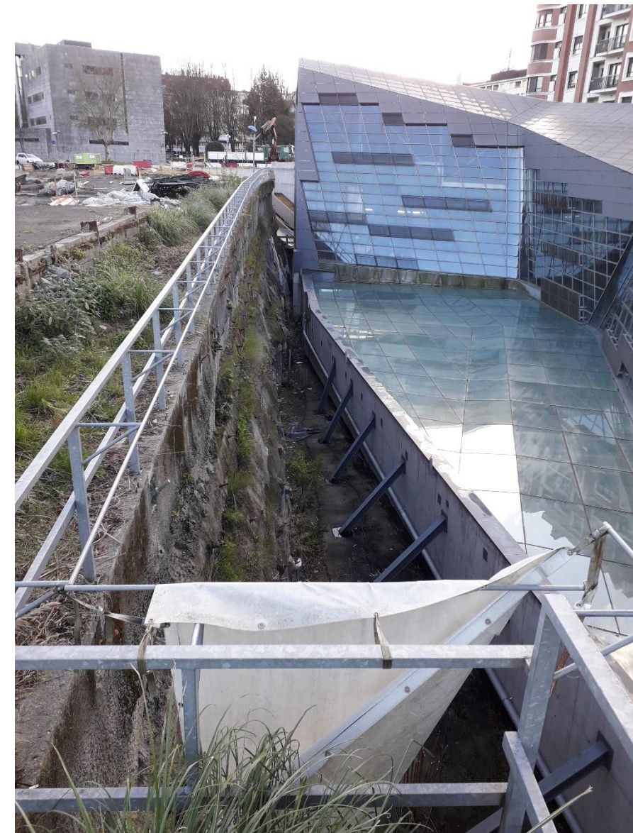
Vista general del muro y la zona de instalación del nuevo ascensor al fondo