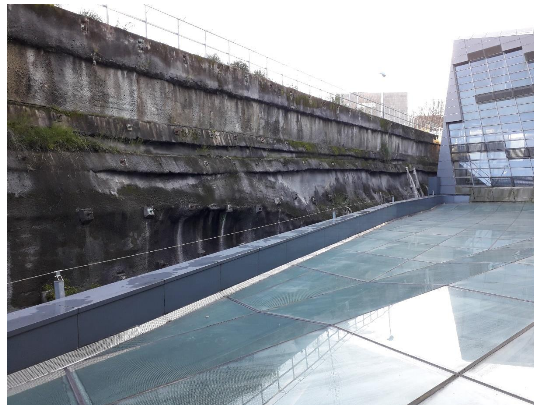
Alzado del muro provisional existente