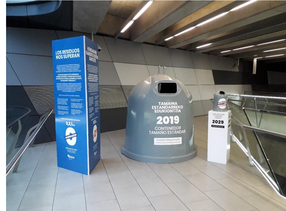
Zona de desembarco de nuevo ascensor en la mezzanina (cota +104,00 m)