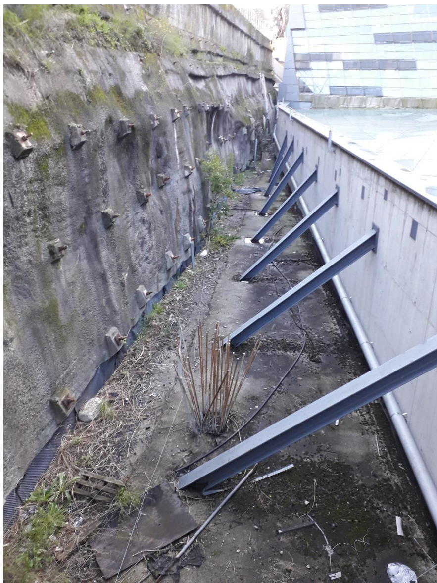
Muro provisional existente y puntales de viga pared de estación