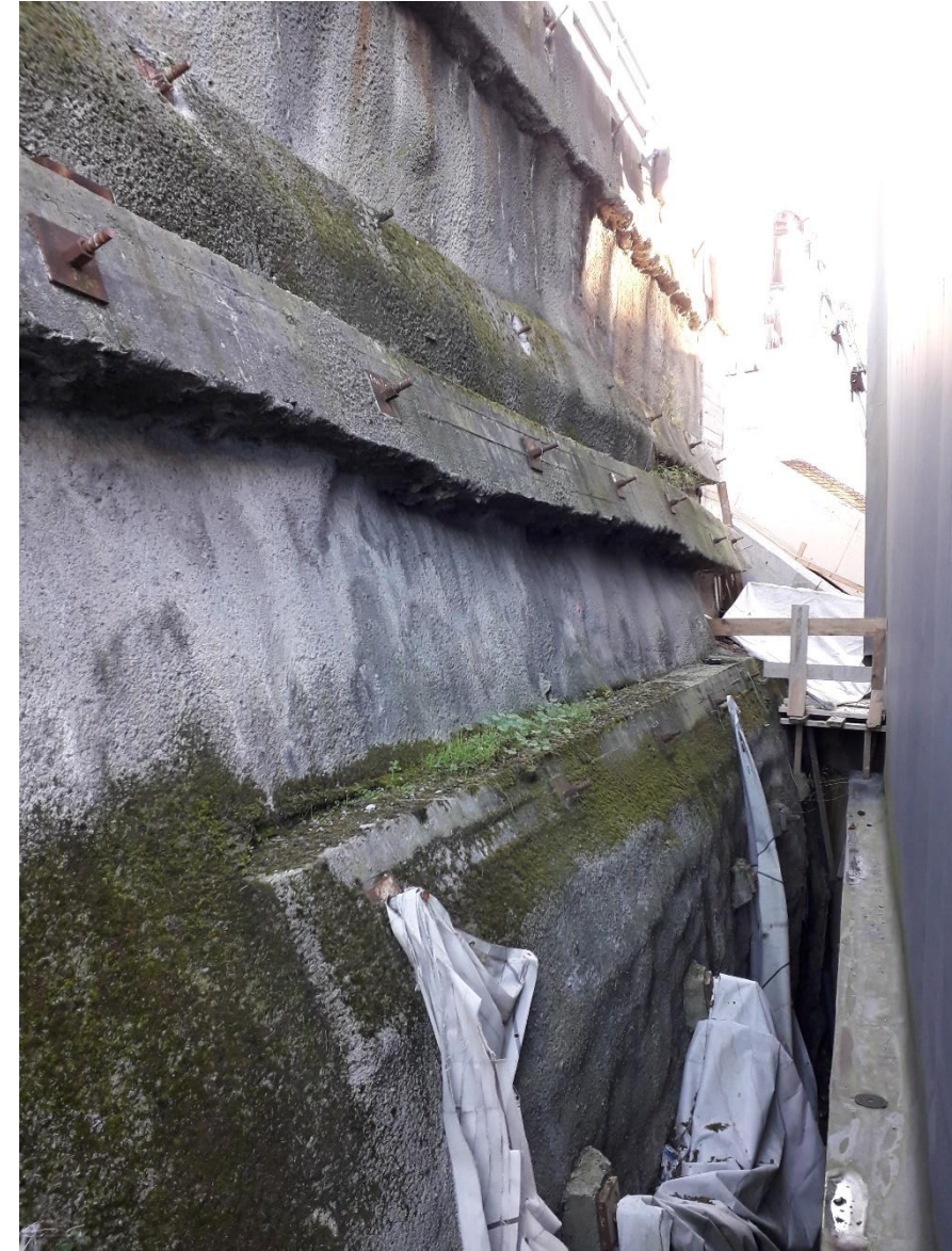
Muro existente en zona de posición de nuevo ascensor