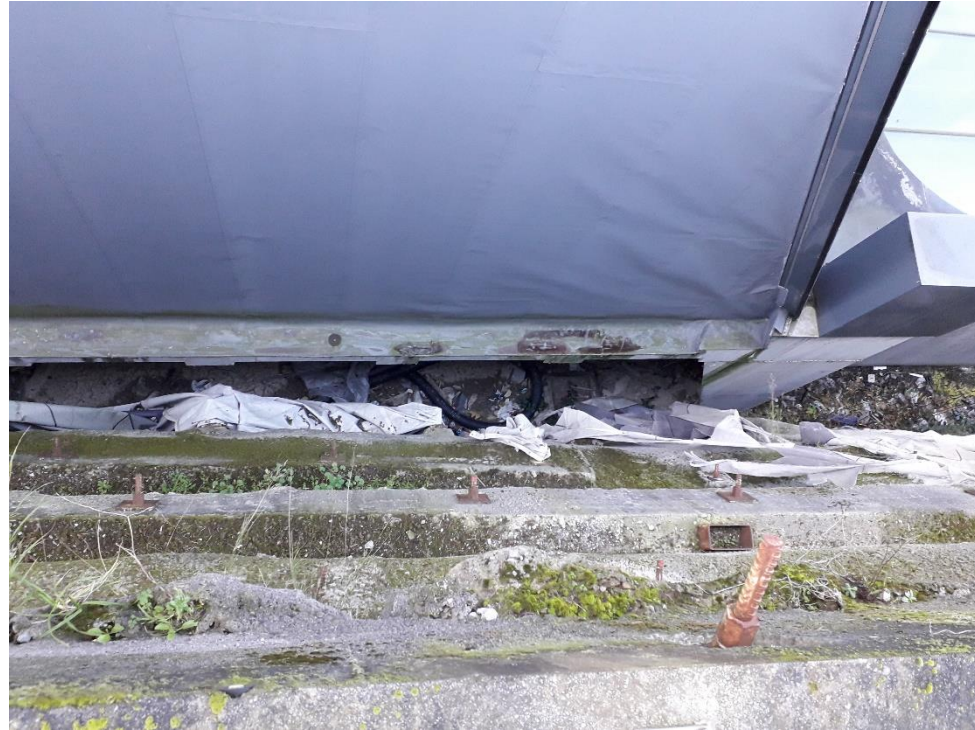
Vista del fondo de la posición del nuevo ascensor